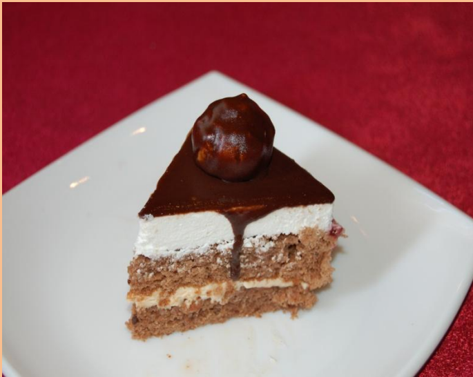
Пирожное «Диана» Бисквит «Прага», трюфельный крем, взбитые сливки, шоколадная глазурь, заварной п/ф 60 гр.