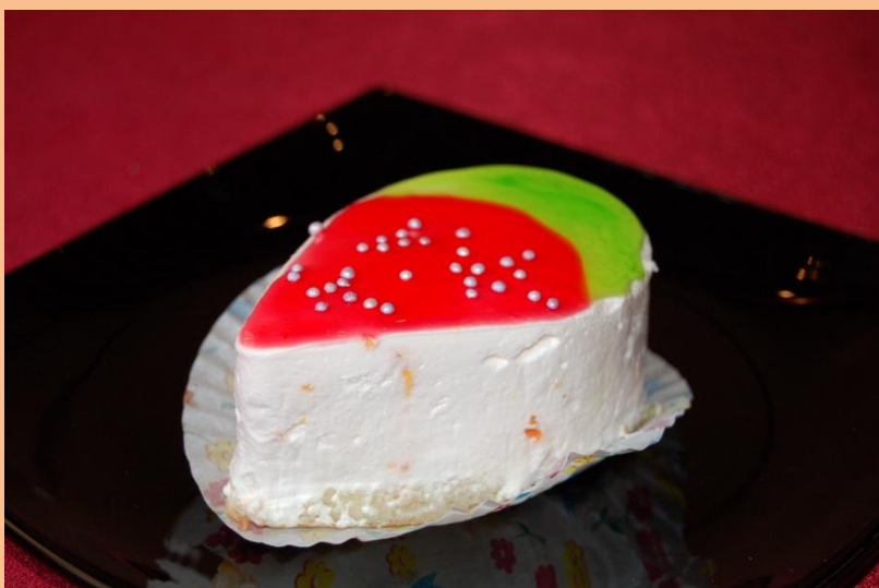
Пирожное «Клубничка» Бисквит, сливки с клубничным фондом, глазурь желейная, карамельные бусинки 90 гр.