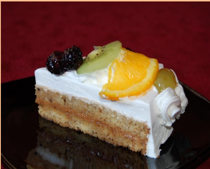
Пирожное «Фруктовая фантазия» Бисквит «Фантазия», варёное сгущённое молоко, взбитые сливки, фрукты, гель нейтральный 130 гр.