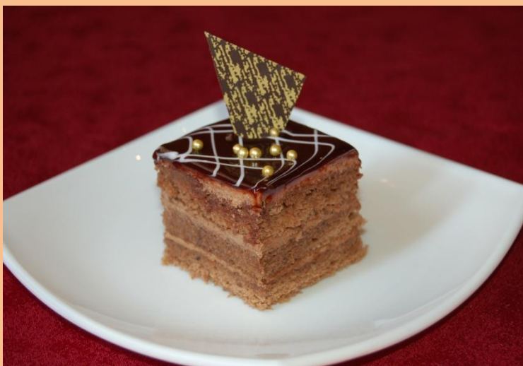
Пирожное «Карибэ» Бисквит «Прага», заварной крем, шоколад, бусинка карамельная, декор-гель шоколадный 80 гр.