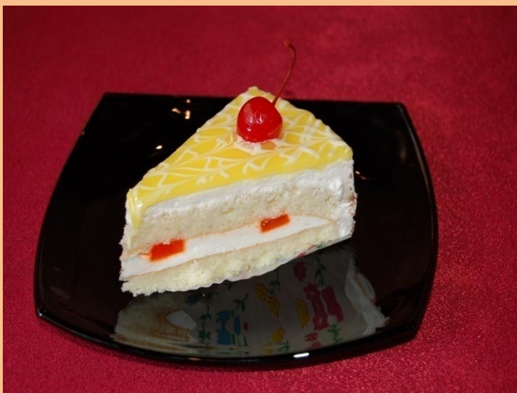
Пирожное «Весеннее» Бисквит, сливки с фруктовым фондом, желе, глазурь декор-гель, вишня в сиропе 100 гр.