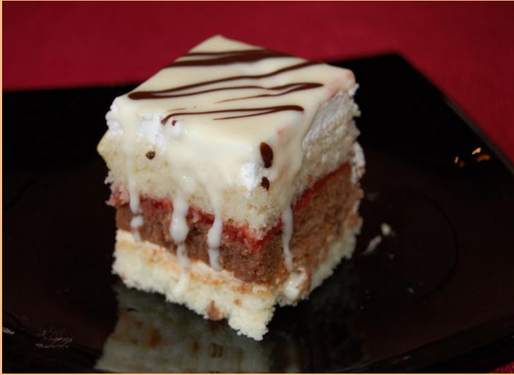
Пирожное « Нежность » Бисквит, джем, трюфельный крем, взбитые сливки, глазурь 60 гр.