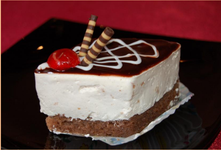
Пирожное «Этюд» Бисквит «Прага», сливки, шоколад, цукаты 90 гр.