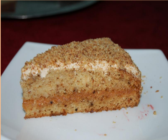
Пирожное «Фантазия» Яйцо, мука, сметана, варёное сгущённое молоко, грецкий орех, крем трюфельный 80 гр.