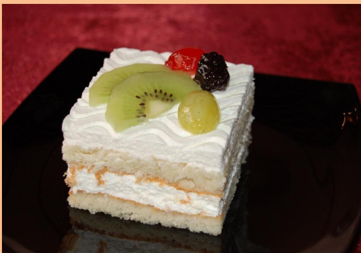
Пирожное «Ягодное шоу» Бисквит, свежие фрукты, ягоды, крем из взбитых сливок 100 гр.