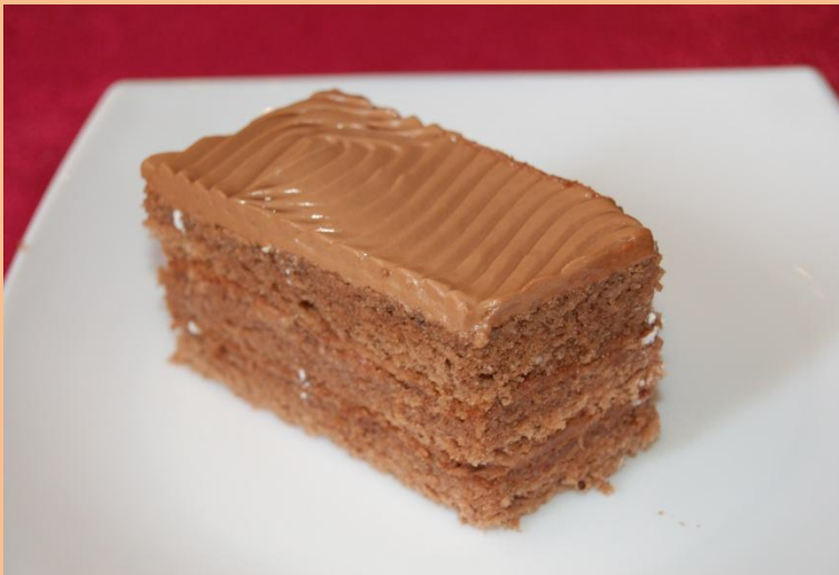
Пирожное «Трюфельное» Бисквит «Прага» с трюфельным кремом 70 гр.