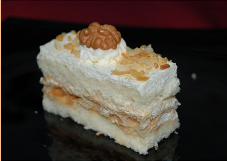
Пирожное «Иринка» Бисквит, сливки, слоёный п/ф, грецкий орех 80 гр.