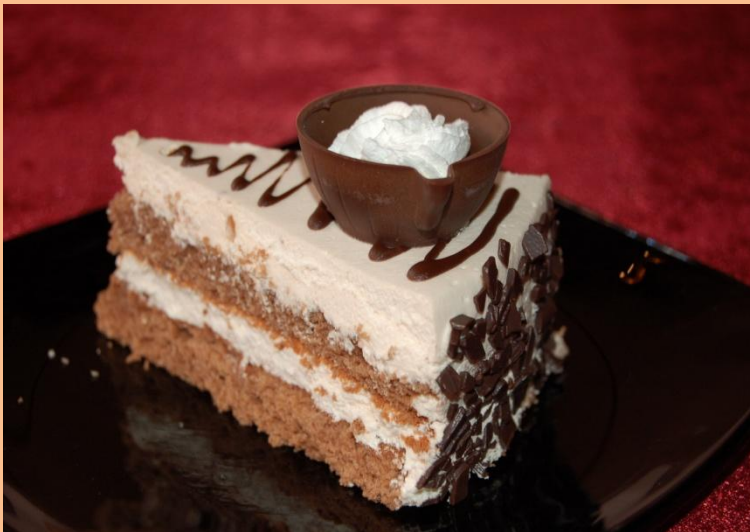
Пирожное «Кофейное» Бисквит, сливки, глазурь шоколадная, шоколад 95 гр.