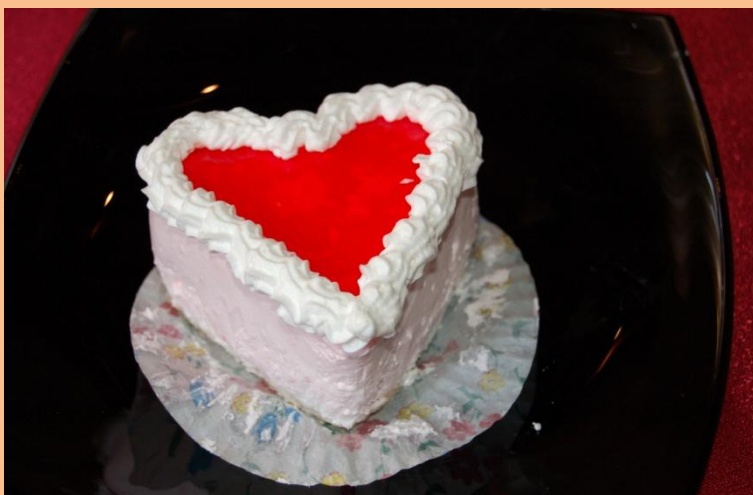
Пирожное «Сердце» Бисквит, сливки с малиновым фондом, желе фруктовое 100 гр.