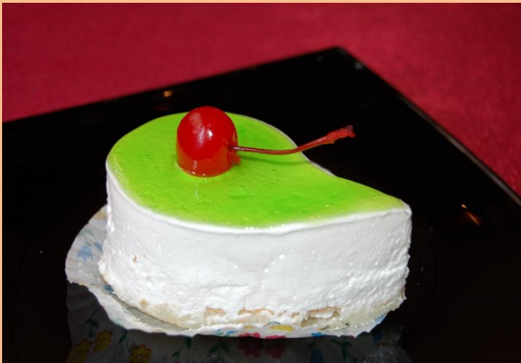
Пирожное «Вишенка» Бисквит, сливки с вишнёвым фондом, глазурь желейная, вишенка в сиропе 90 гр.