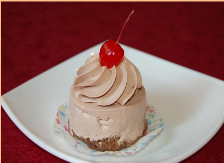
Пирожное «Триумф» Бисквит «Прага», сливки с шоколадом, вишенка в сиропе 90 гр.