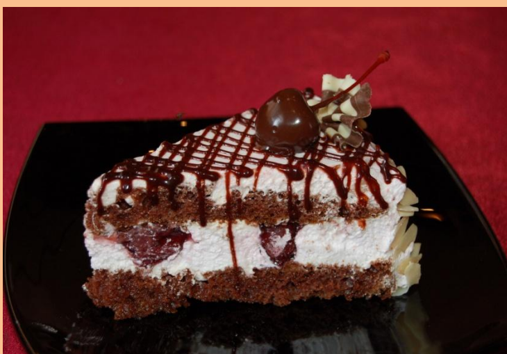
Пирожное «Чёрный принц» Бисквит шоколадный «Фантазия», сливки, миндальные пластинки, вишня в сиропе, сливки с вишнёвым фондом, делефрут, глазурь 120 гр.